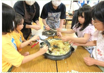
昼食は宅配弁当の日もあれば、最終日はみんなで焼きそばを作ってたべました。