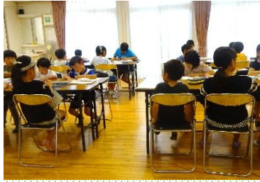
夏休みの宿題やそれぞれの自由学習に集中!