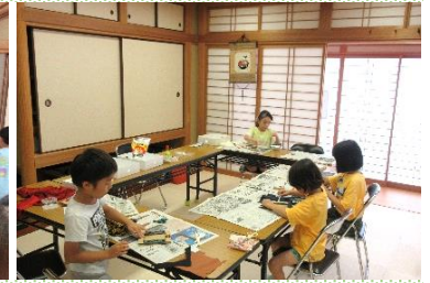
フリータイムは工作!