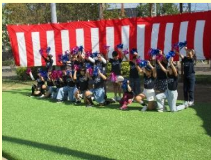
いぶつきーず 井吹西学童