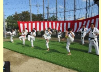
空手道大内琉 気心会