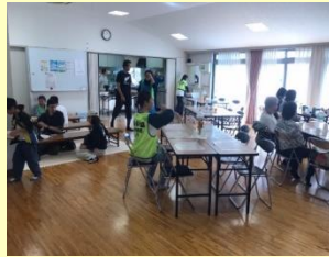
福祉センター内 休憩所