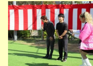
芝生の舞台に感謝! ひまわりライフさん