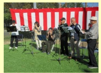
ハーモニーメイト!