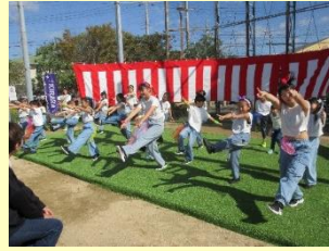
ダンシングチーム KIRARA