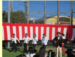
皆で歌おう 「明日があるさ」