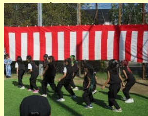
スクービードゥー