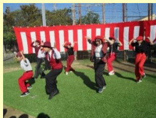
ストリートダンス I-soul