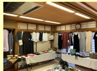
和らぎ手作りサークル の作品