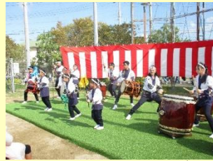
和太鼓クラブ 咲菫(すみれ)